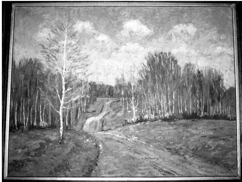
Картина А.С. Зоболева.

«Самое приятное, когда зритель находит в твоей работе что-то близкое для себя», – говорит А.С. Зоболев. Уверена, бабынинцы, увидевшие работы отца и дочери Зоболевых, нашли это близкое. Оно просится в душу тонкими, звенящими струнами устремленных к небу берез, листвою осеннего леса, золотой синевой воды и лазурью неба. Их творчество – о мире, в котором мы живем, простом, понятном и прекрасном. Большое спасибо организато-